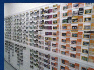
砂防カード展示コーナー