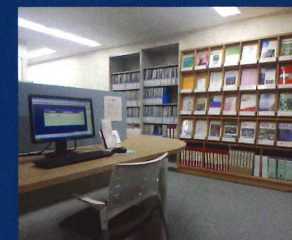
図書検索用 端末機