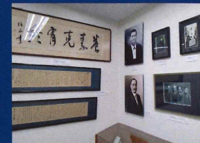
併設する赤木記念館